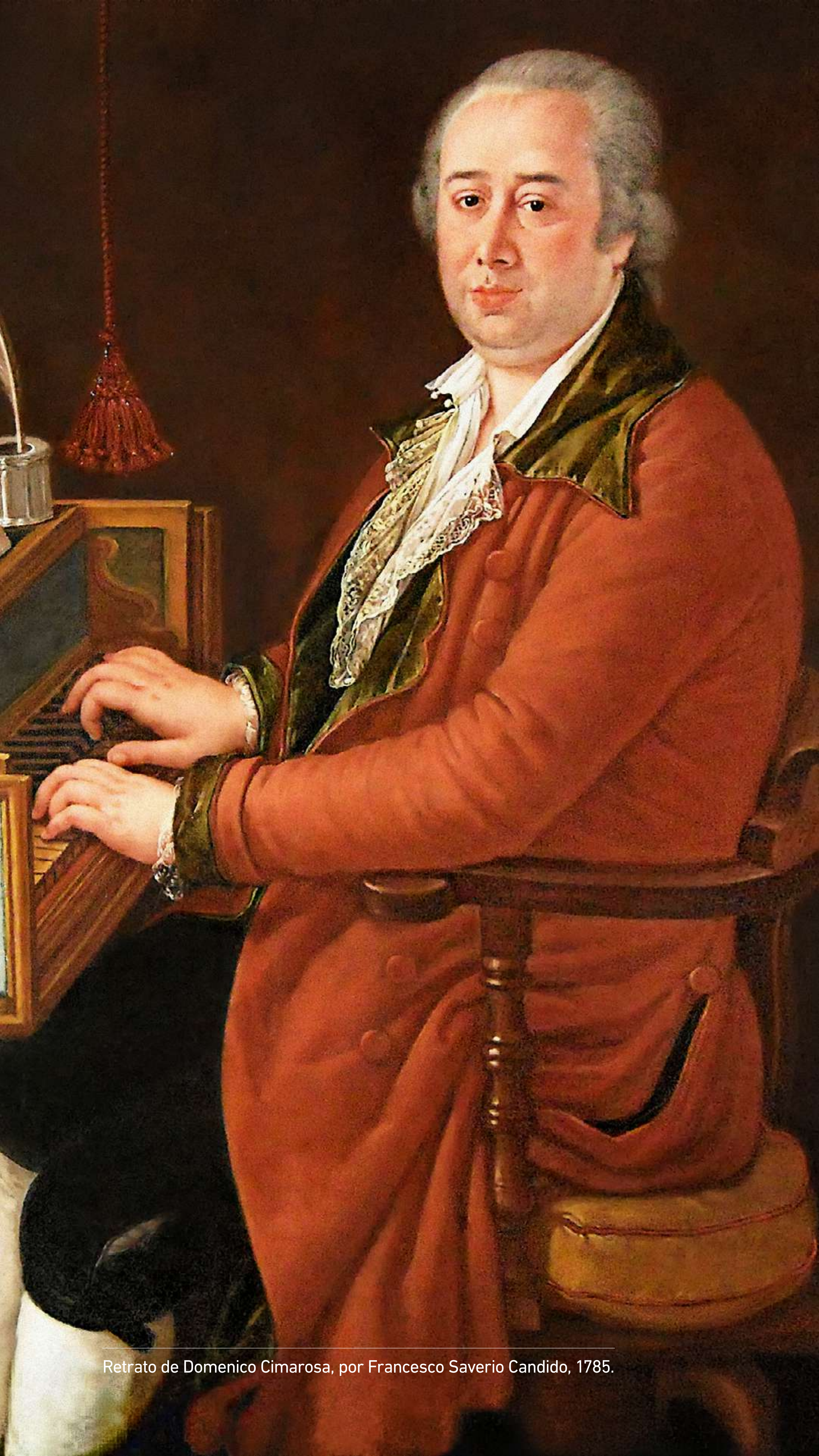
Retrato de Domenico Cimarosa, por Francesco Saverio Candido, 1785.